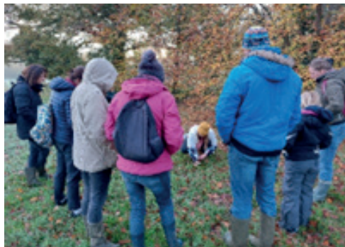
Sortie Nature à Guichen, nov.2023

Des animations grand public ont été organisées (concours photo, sorties nature pour découvrir la biodiversité locale), ainsi que des stands pour échanger sur nos actions en faveur de la biodiversité. Pour la première année VHBC a également animé les Mesures Agro-Environnementales et Climatiques Biodiversité en partenariat avec Eaux et Vilaine et le SMGBO