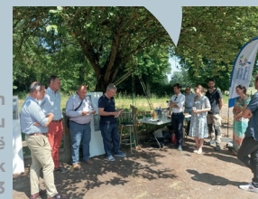
Intervention des élus au Club Canoë Kayak Juin 2023

Cette intervention aura permis de récupérer pas moins de 3,3 tonnes de matériaux qui connaîtront une nouvelle vie, et donc d'économiser des ressources !