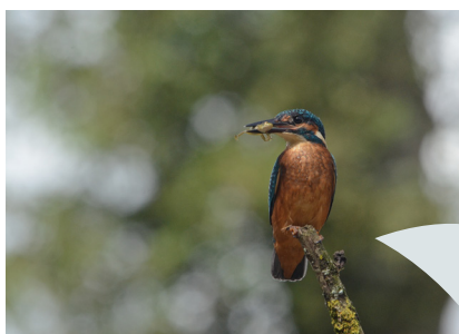
« Le prédateur des zones humides » par J. Renaud Pochet prise à Goven, 1er prix thème milieux humides