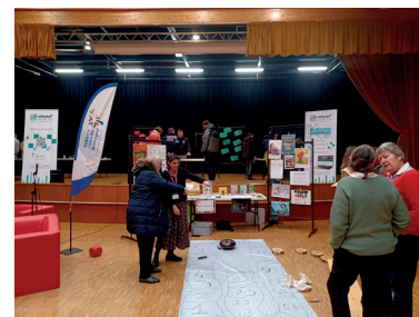
Soirée prévention des addictions - 7 déc.2023

Toutes nos actions ont été testées et approuvées par un panel de participants ce vendredi 7 décembre à l'espace des Lavandières à Goven.