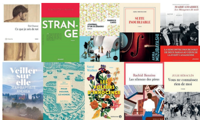
Les titres en lice pour le prix de l'Agora

Les bibliothèques ont à cœur de faire découvrir à leurs lecteurs des romans qu'ils n'auraient pas lus par ailleurs. C'est notamment le but des prix des lecteurs organisés par l'Agora, la médiathèque de Bourg des Comptes, et par la médiathèque communautaire du Chorus située à Val d'Anast.