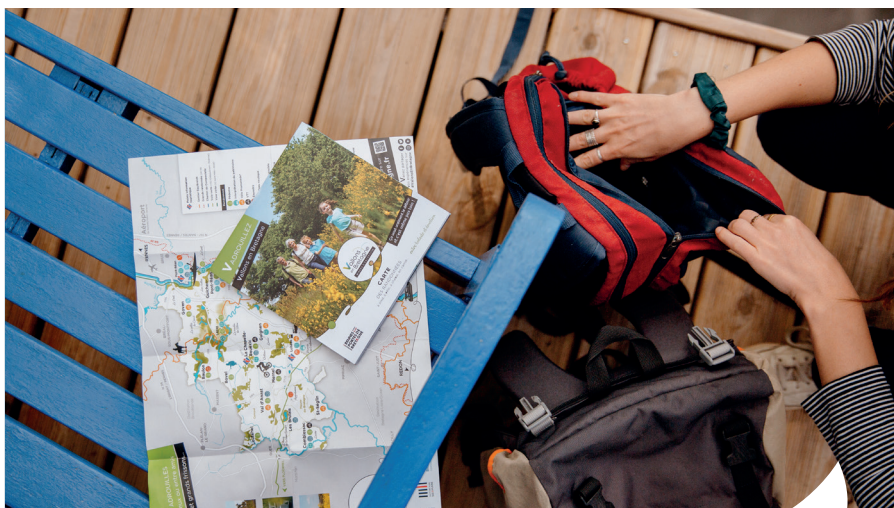
© Margot Carte - Bain d'argile à Saint-Senoux

L'Office de Tourisme Vallons en Bretagne a été créé le 1 er janvier 2024. L'aboutissement de 5 années de travail pour la valorisation des richesses touristiques de Vallons de Haute Bretagne Communauté !