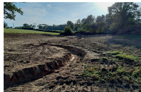
Travaux sur le cours d'eau la Croix Macé à Goven

Dans le contexte de changement climatique, il est urgent d'agir notamment sur le fonctionnement des milieux aquatiques du territoire. Ces travaux, réalisés par des entreprises spécialisées, sont accompagnés financièrement par l'Agence de l'Eau Loire-Bretagne, le Département 35 ainsi